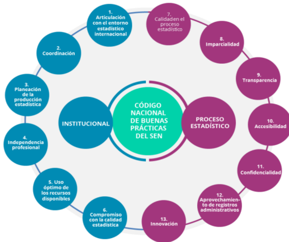
Figura 4 Estructura del código nacional de buenas prácticas del Sistema Estadístico Nacional (CNBP)

Tomado del código nacional de buenas prácticas del Sistema Estadístico Nacional (CNBP) 2017 página 4.