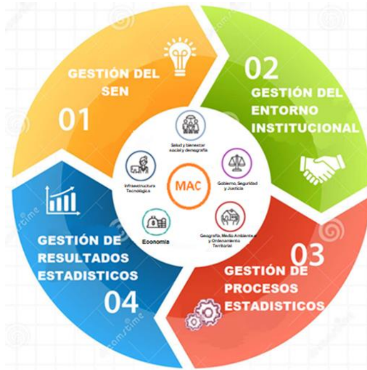
Figura 3 Representación del Marco de Aseguramiento de Calidad para Colombia