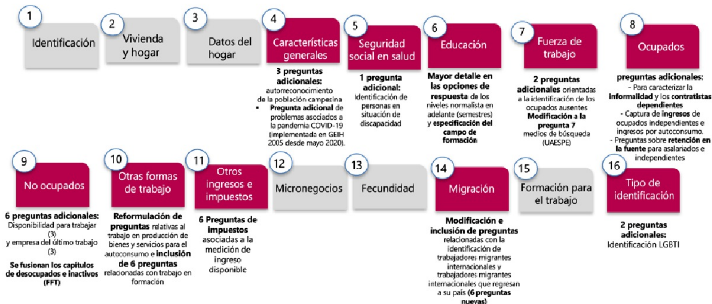
Figura 3. Ajustes realizados al cuestionario

Las mejoras realizadas al cuestionario de la GEIH fueron la inclusión de preguntas nuevas en los capítulos de Características generales, Seguridad social en salud, Fuerza de trabajo, Ocupados, Otras formas de trabajo, Otros ingresos e impuestos, Migración y Tipo de identificación; la reformulación de algunas preguntas de los módulos de Educación, Fuerza de trabajo, Ocupados y Otras formas de trabajo y la integración de los capítulos de Desocupados e Inactivos, el cual se denomina No Ocupados.