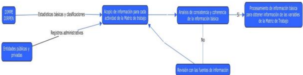
Diagrama 1. Procedimiento de validación de las fuentes de información