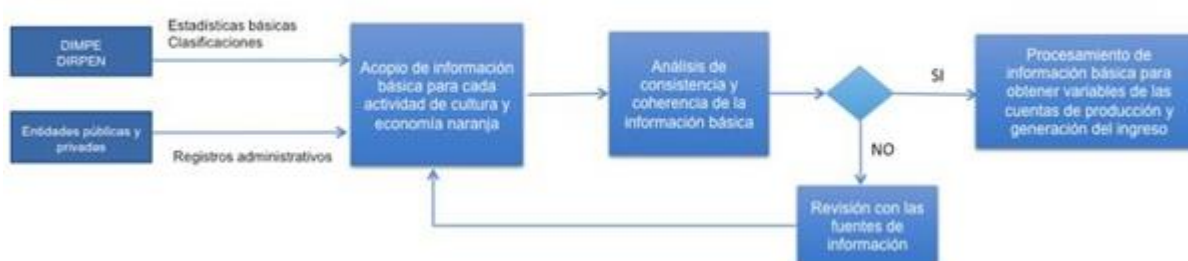
Diagrama 1. Proceso de validación de las fuentes de información

El diagrama 1 representa de manera secuencial, el proceso de validación de las fuentes de información antes de iniciar el método de cálculo.