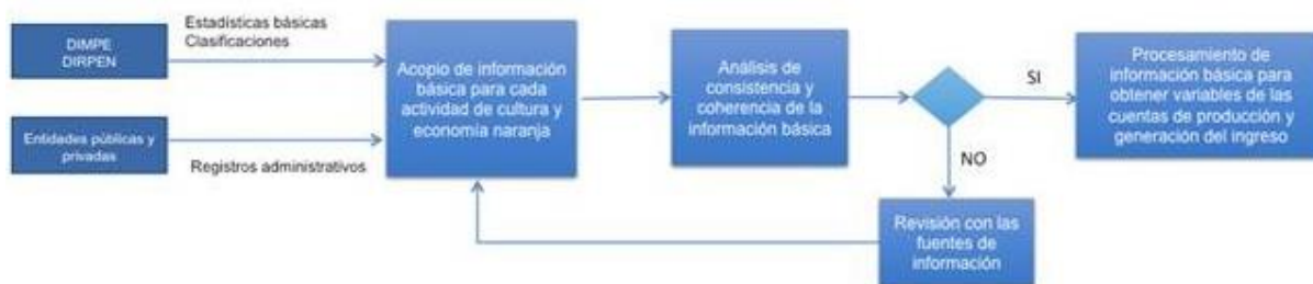
Diagrama 1. Proceso de validación de las fuentes de información