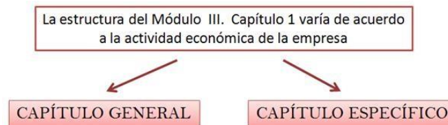
Imagen 1. Estructura del Módulo III