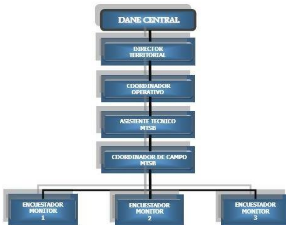
Imagen 2. Organigrama Operativo de la MTSB

A continuación se muestra el organigrama operativo de la MTSB: