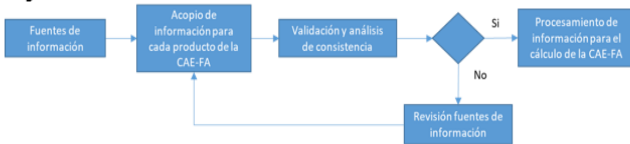
Diagrama 1. Proceso de validación de las fuentes de información