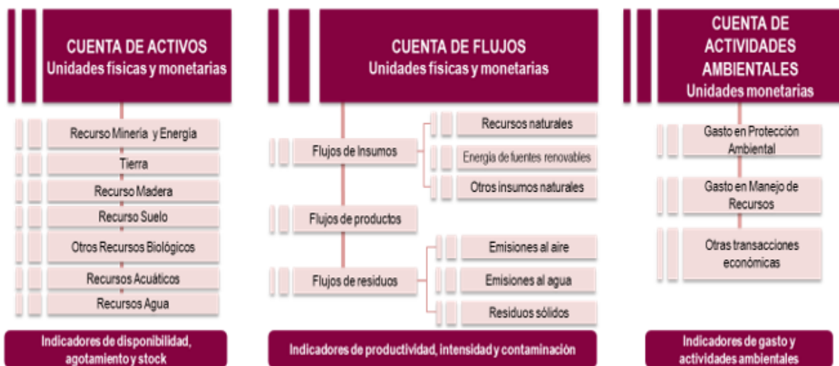
Gráfica 1. Estructura Marco Conceptual SCAE

El SCAE es un marco multipropósito basado en conceptos, definiciones, clasificaciones y normas contables que describe las interacciones entre el ambiente y la economía, mediante el análisis de tres grandes áreas: los flujos físicos de materiales y energía dentro de la economía, y entre la economía y el ambiente; los stocks de los activos ambientales y su variación; y las actividades económicas y transacciones asociadas con el ambiente (ver gráfica 1).