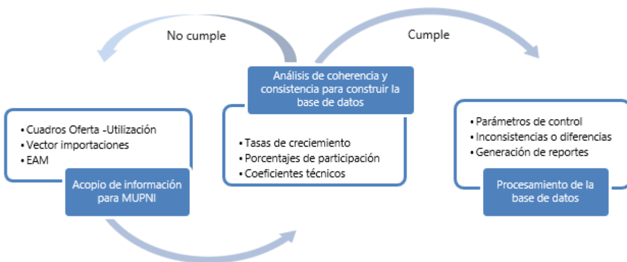
Diagrama 1. Procedimiento de validación de las fuentes de información

Las diferentes copias de seguridad de los códigos permiten a cualquier usuario de software libre ya sea R o Python, replicar los cálculos inmediatamente. En caso de que se presenten inconvenientes con la información o replanteamientos en los insumos presentados, estos códigos permiten tener la disponibilidad del cálculo tal cual se ha realizado en entregas y publicaciones previas, sujetas a la disponibilidad de información del año que se desee realizar. Finalmente, para la MUPNI no se realiza imputación de datos, pero realizan los procesos de validación y consistencia de la información básica.