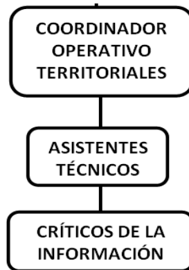
Gráfico 1. Organigrama Operativo

Dadas las instrucciones en DANE Central y establecidos los objetivos y criterios de la investigación y posterior a la prueba piloto de julio y agosto 2012, se llevó a cabo el operativo de la EVI que abarcó el período septiembre 2012 a agosto 2013, cuyo organigrama se observa a continuación: