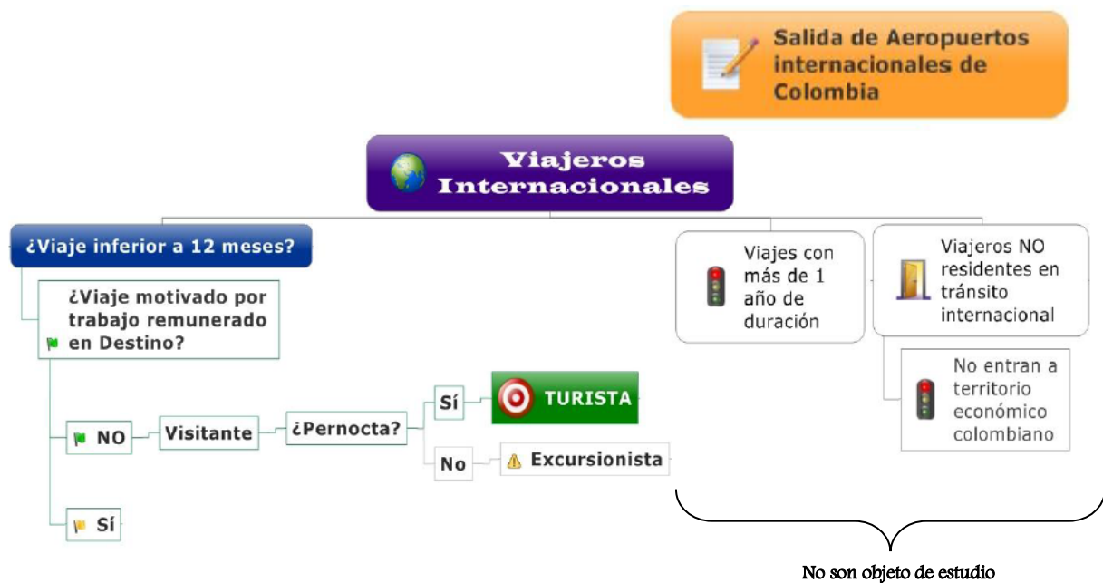
Gráfico 1. Diagrama Viajeros Internacionales

A continuación se presenta un esquema en el cual se muestra la población objeto de estudio, los viajeros internacionales, entendiéndose que se excluyen: los viajeros que realizan un viaje por más de un año, los viajeros no residentes en tránsito internacional por Colombia y los viajes que son remunerados en el país de visita.