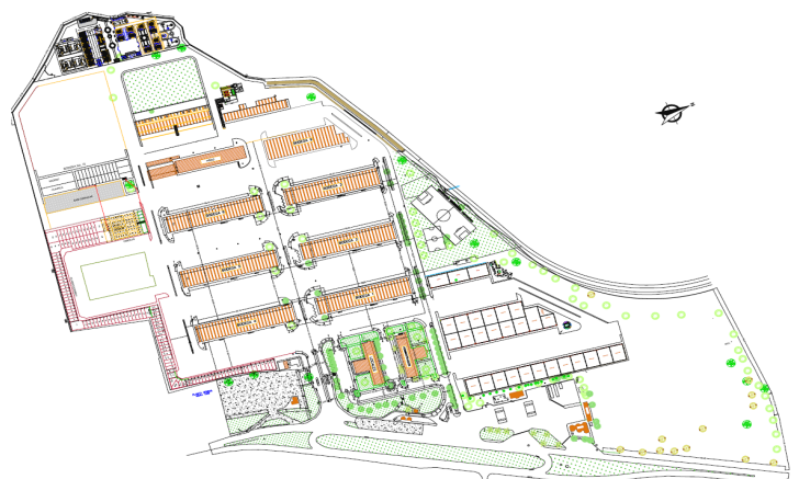
Figura 1. Mapa de Centroabastos

Finalmente otro factor, y no menos importante que los anteriores, es el hecho de que la central de abasto de Bucaramanga es uno de los principales actores en el sistema de aprovisionamiento de alimentos frescos que son remitidos hacia los municipios de la Costa Atlántica y Norte de Santander; destacándose el tomate