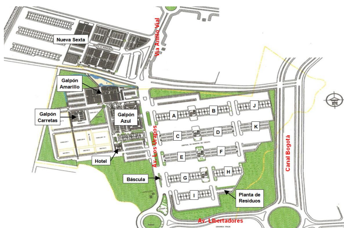
Figura 1. Plano Cenabastos