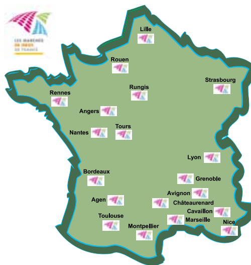
Figura 2. Mapa de la ubicación de la red de mercados mayoristas en Francia