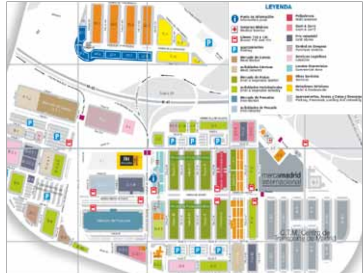
Figura 2. Mapa de MERCAMADRID