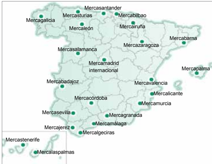
Figura 1. Mapa de la red de MERCASA

Fuente: www.mercasa.es - Información tomada el 24 de septiembre de 2013.