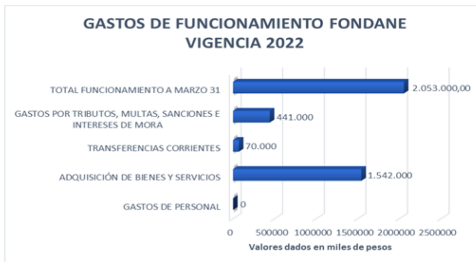
Gráfico 2. Gastos de funcionamiento FONDANE 2022