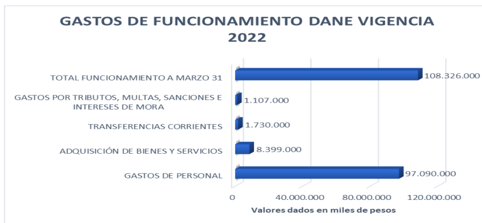
Gráfico 1. Gastos de funcionamiento DANE 2022