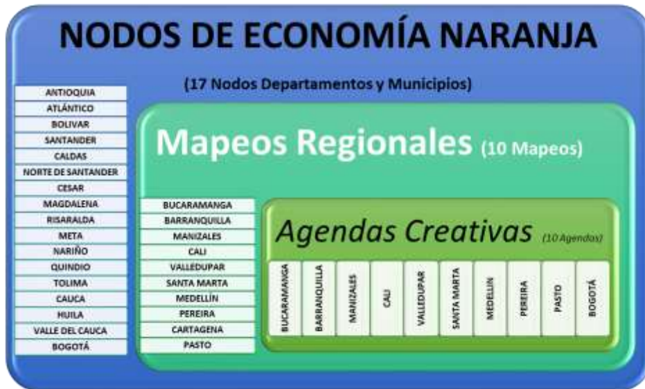
Gráfica No. 3 Estrategias Territoriales