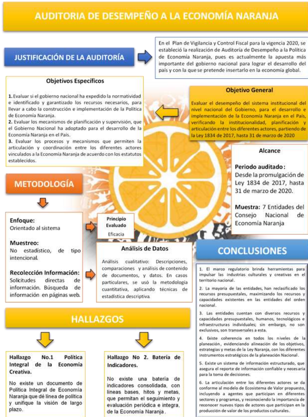
Gráfica No. 1 La Auditoría en un Vistazo