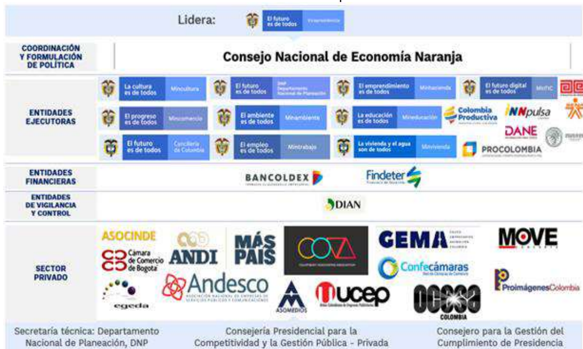
Gráfica No. 10 Actores Camino al Cumplimiento