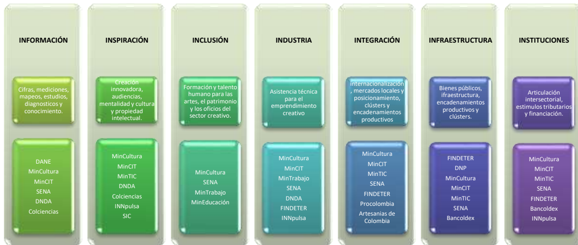
Gráfica No. 6 Líneas de trabajo de la Economía Naranja y actores

discriminar las acciones y responsabilidades que tendrán los diferentes actores vinculados en la implementación de las 7íes dentro del marco de la Economía Naranja, como se describe en el siguiente gráfico: