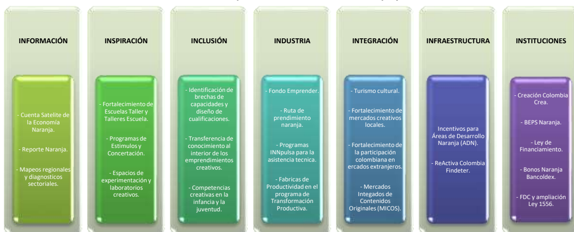
Gráfica No. 7 Líneas de trabajo de la Economía Naranja y acciones

A su vez, dio paso a la articulación e información por parte del gobierno central con la ciudadanía y partes interesadas, por medio de diferentes programas y estrategias, de la siguiente manera: