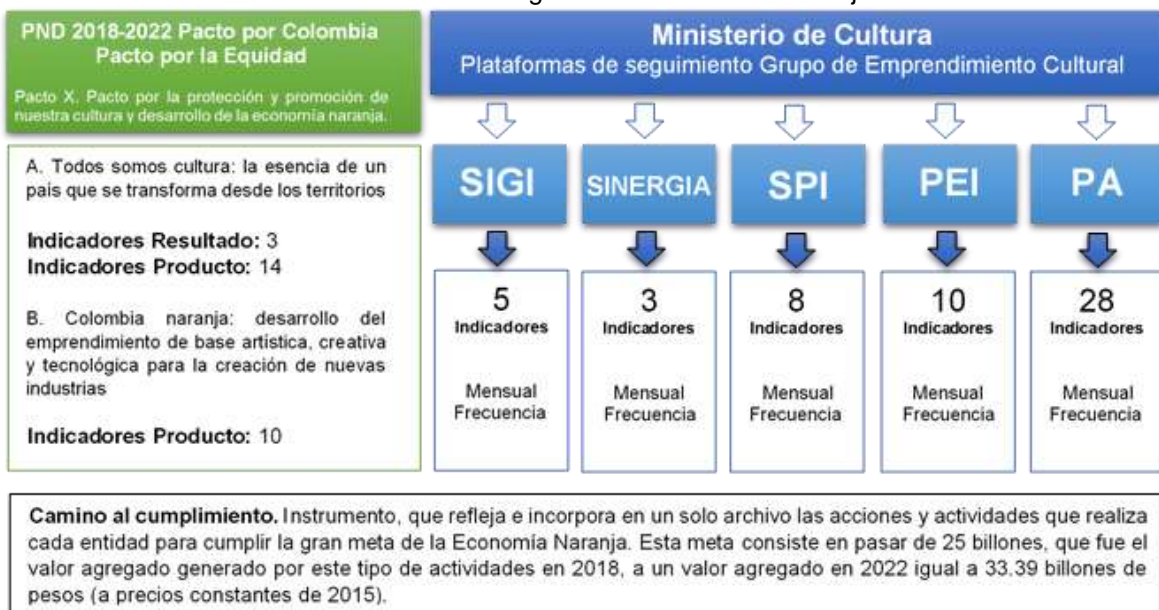
Mecanismos de Seguimiento Economía Naranja