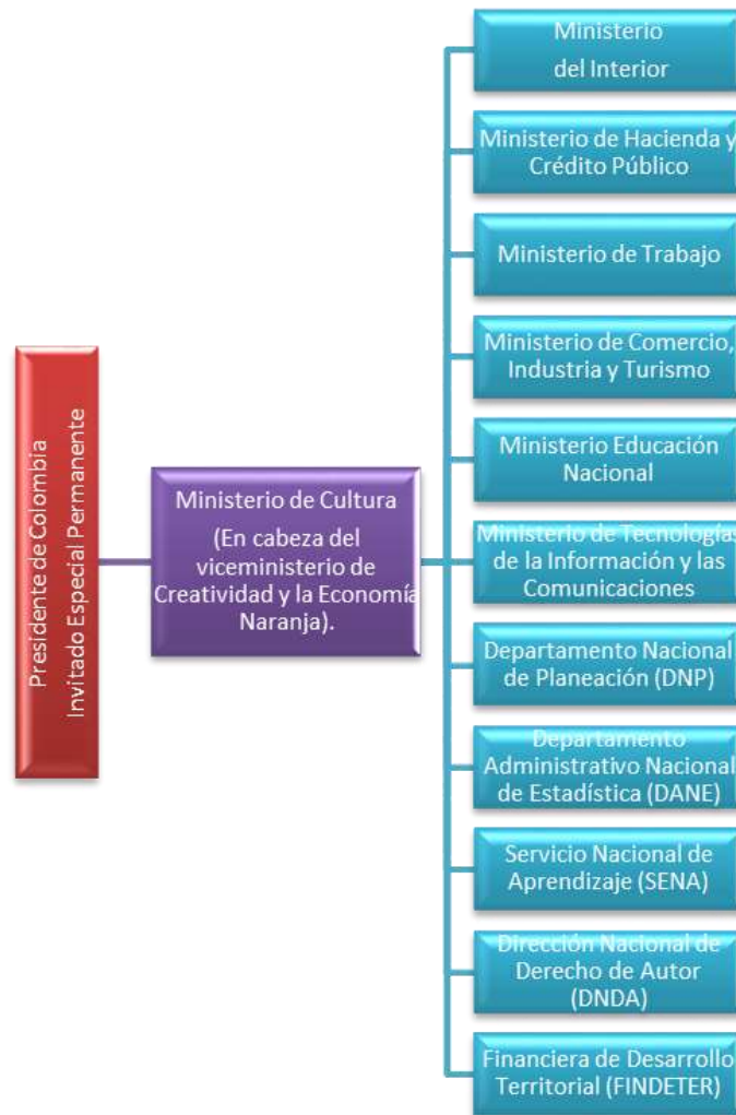
Gráfica No. 8 Miembros del Consejo Nacional de Economía Naranja

Fuente: Decreto 1935 de 2018. Elaboró: Equipo Auditor.