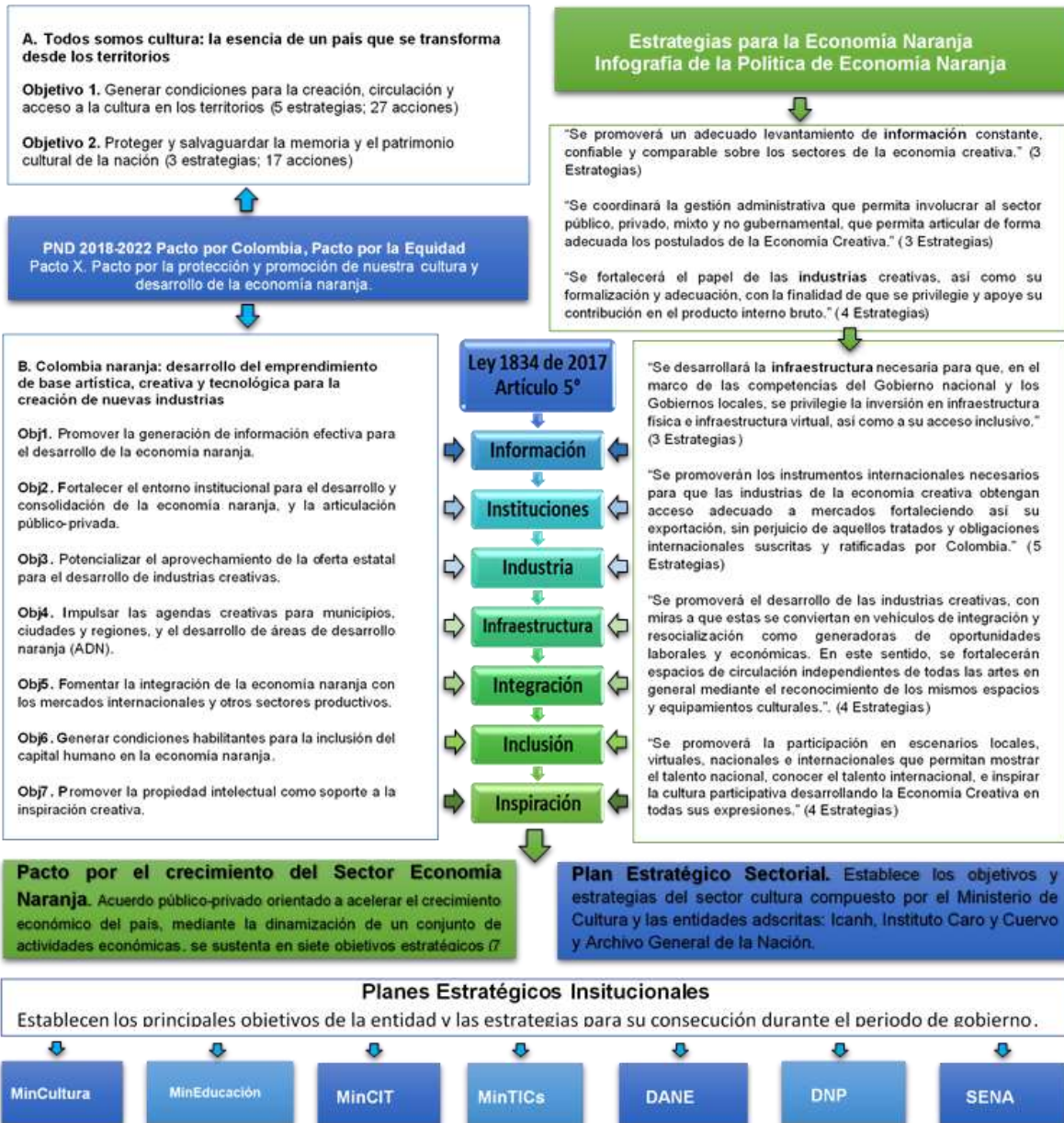
Gráfica No. 2 Instrumentos Estratégicos de Planeación en Economía Naranja

Fuente: Información proporcionada por el Ministerio de Cultura. Elaboró: Equipo auditor