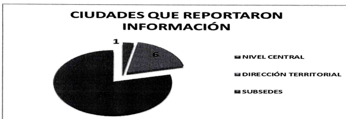
Gráfica No. 1

A continuación se presenta una gráfica con los principales datos de los participantes en el diligenciamiento de la encuesta, y consolidación de la Relación de Equipos de Cómputo existentes a nivel Nacional para DANE - FONDANE: