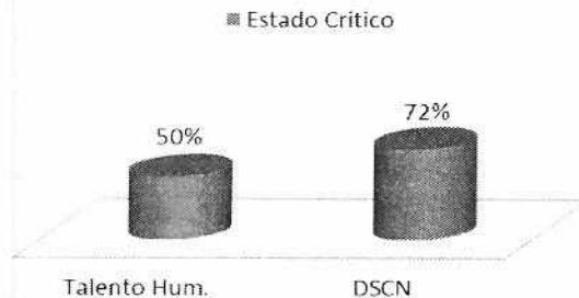
Grafica 2. Indicadores inferiores al 90%

Teniendo en cuenta el Informe de seguimiento al Plan de Acción para el primer trimestre de 2018, publicado en la página web de la Entidad y el reporte descargado del Sistema de Apoyo a la Planeación y Gestión Institucional –SPGI, podemos observar que se identificaron dos (2) indicadores con resultados inferiores al 90% en el rango de calificación y evaluación reportado por el Área de Talento Humano y Síntesis y Cuentas Nacionales, los cuales hacen referencia al Indicador “Estrategia para desarrollar la cultura de autocontrol del Sistema de Gestión de Calidad implementada DANE”.