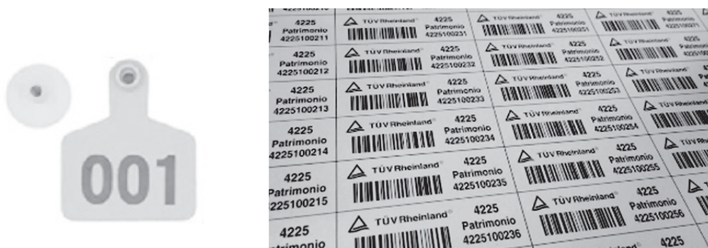
Gráfico 6: Elementos de control del registro

A continuación se muestran algunos ejemplos: